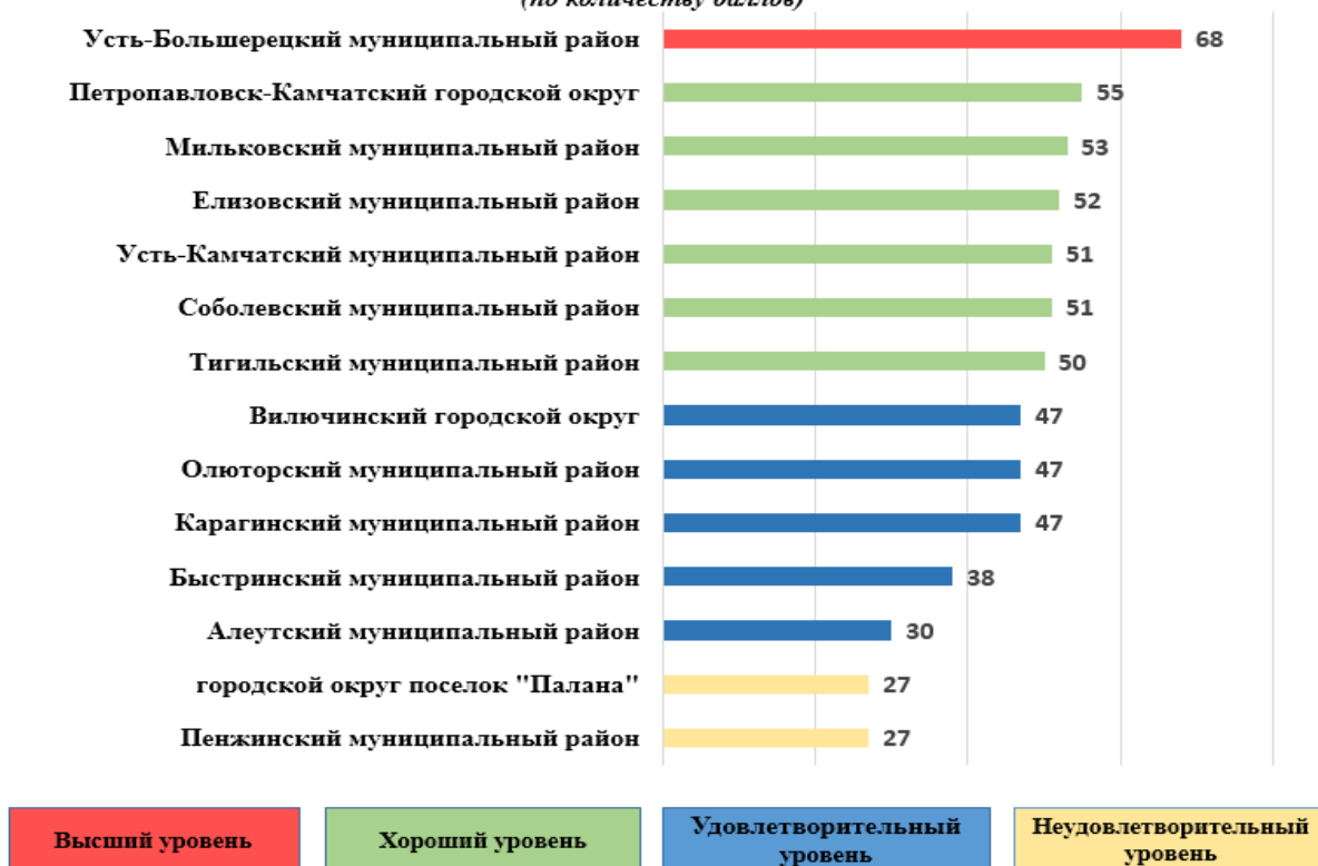
Результаты рейтинга качества ОРВ и экспертизы в муниципальных образованиях Камчатского края за 2018 год (по количеству баллов)

К «высшему уровню» отнесен Усть-Большерецкий муниципальный район. У данного муниципального образования отмечается позитивная динамика в части правового и методического сопровождения проведения ОРВ и экспертизы, а также практической части реализации института ОРВ.